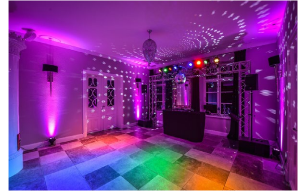
Raum „Saal Ratekau“