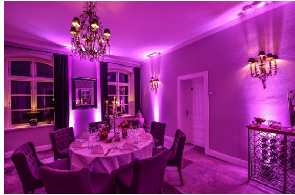
Raum „Saal Timmendorf klein“