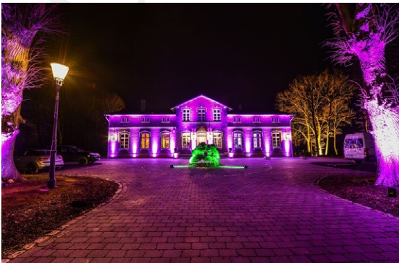
Hausfront, inkl. Beleuchtung der Bäume