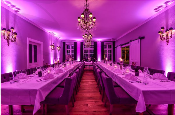
Raum „Saal Timmendorf“